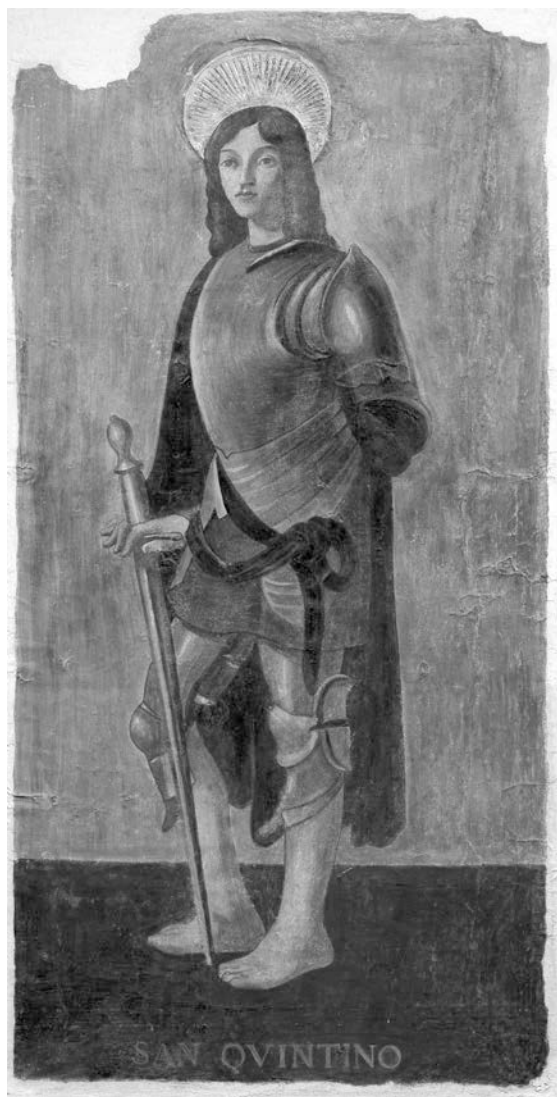
Uno degli affreschi staccati con i Dieci santi guerrieri di Pietro Morando (per gentile concessione Banca di Legnano SPA, già Cassa di Risparmio di Alessandria SPA).