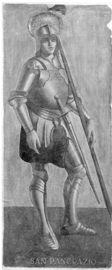
Uno degli affreschi staccati con i Dieci santi guerrieri di Pietro Morando.